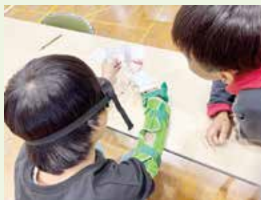
実施日 令和7年10月30日(木) 場 所 粕屋中央小学校(4年生)

内容は、高齢者や障がいのある方に関する身体的機能の疑似体験(車椅子体験・高齢者疑似体験・アイマスク体験)を行いました。高齢者の方や障がいのある方の気持ちを体験し、どのようなサポートができるのかを考える機会となりました。ふくしについて身近なものとしてとらえ、誰もが暮らしやすい粕屋町になることを願っています。