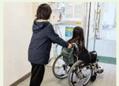
実施日 令和7年11月27日(木) 場 所 粕屋西小学校(4年生)